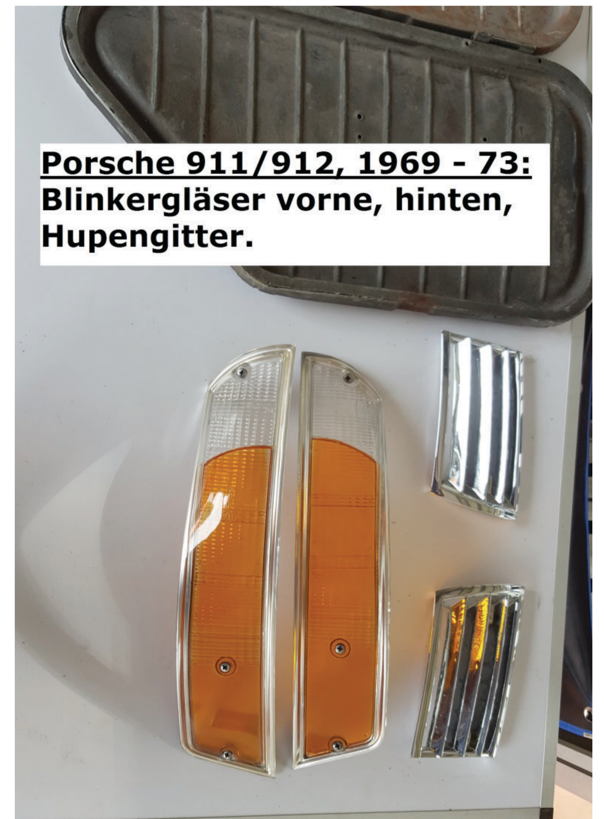
Porsche 911/912, 1969 - 73: Blinkergläser vorne, hinten, Hupengitter.