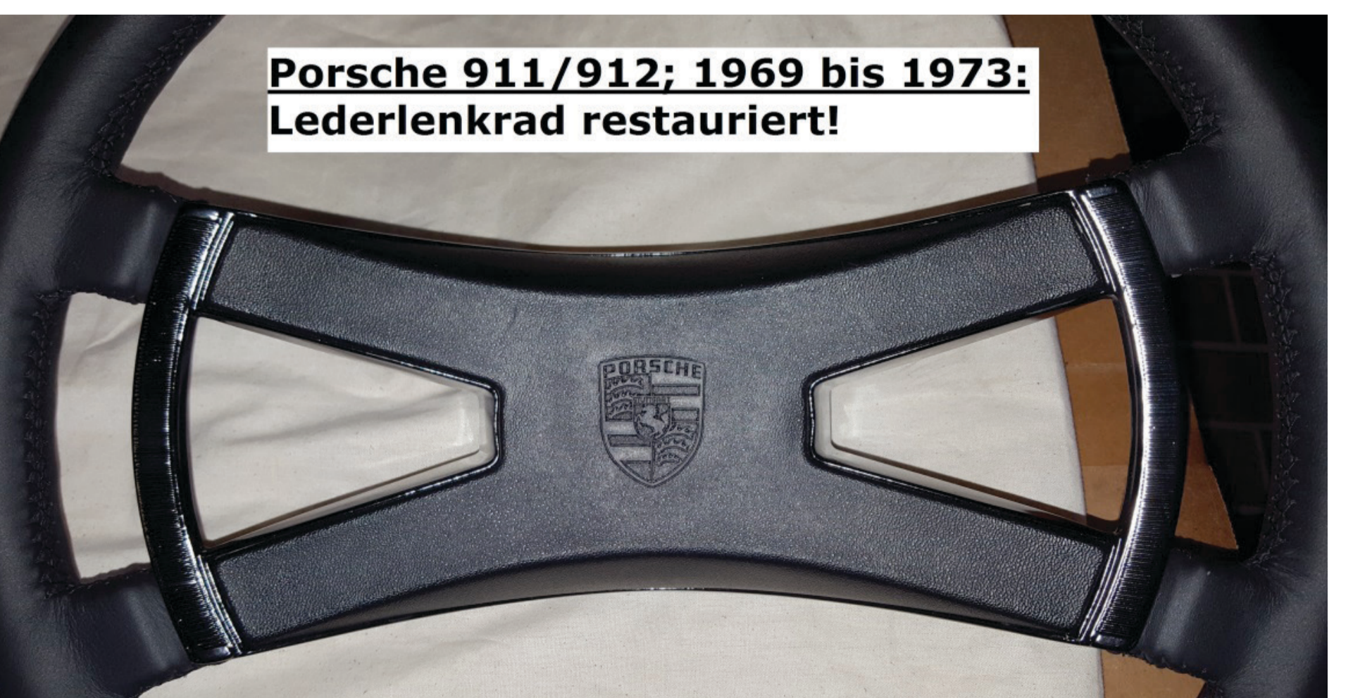
Porsche 911/912; 1969 bis 1973: Lederlenkrad restauriert!

*)Privater Sammler reduziert seinen Bestand. Alles sind originale Fotos. Weitere Informationen und Teile sowie Preise auf Anfrage!