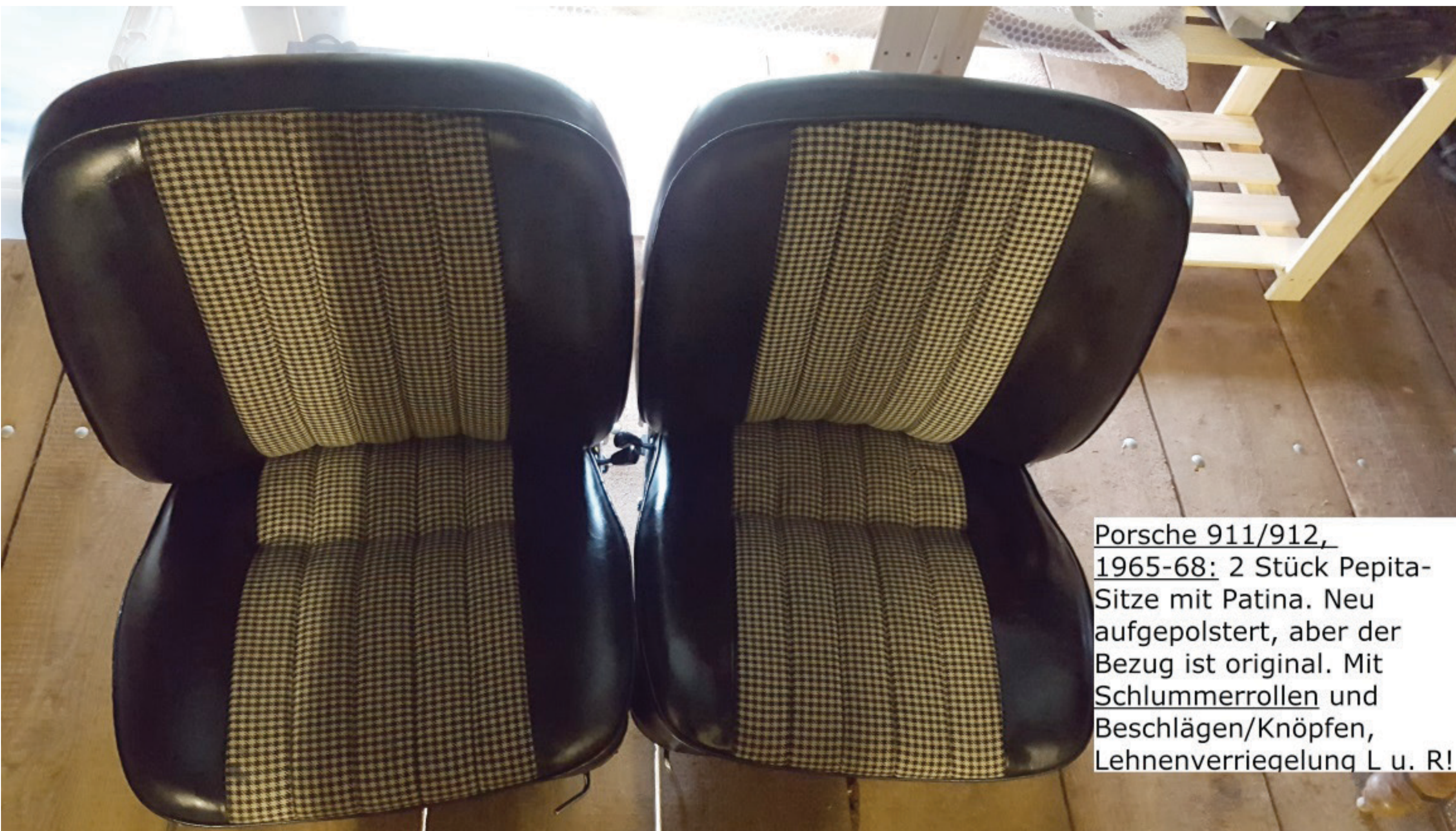
Porsche 911/912, 1965-68: 2 Stück Pepita-Sitze mit Patina. Neu aufgepolstert, aber der Bezug ist original. Mit Schlummerrollen und Beschlägen/Knöpfen, Lehnenverriegelung L u. R!