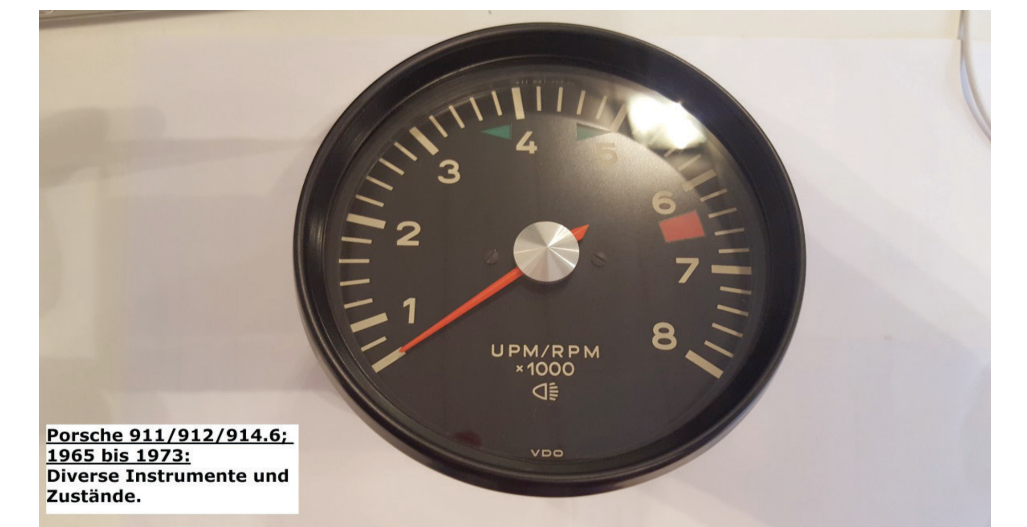
Porsche 911/912/914.6; 1965 bis 1973: Diverse Instrumente und Zustände.