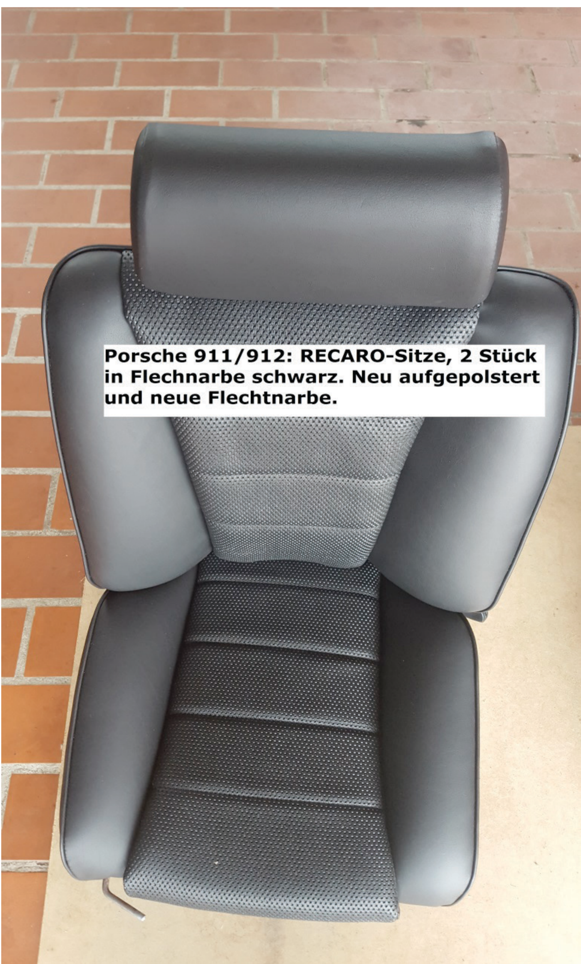
Porsche 911/912: RECARO-Sitze, 2 Stück in Flechnarbe schwarz. Neu aufgepolstert und neue Flechnarbe.