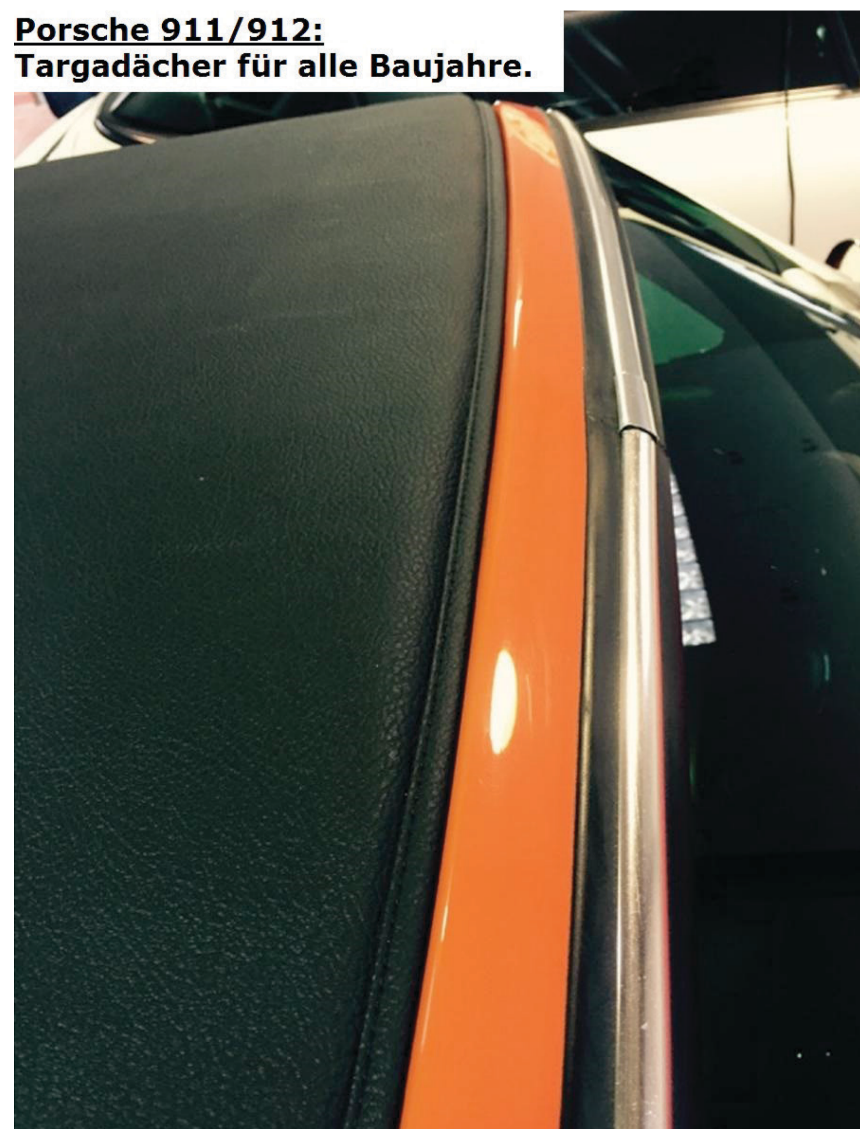
Porsche 911/912: Targadächer für alle Baujahre.