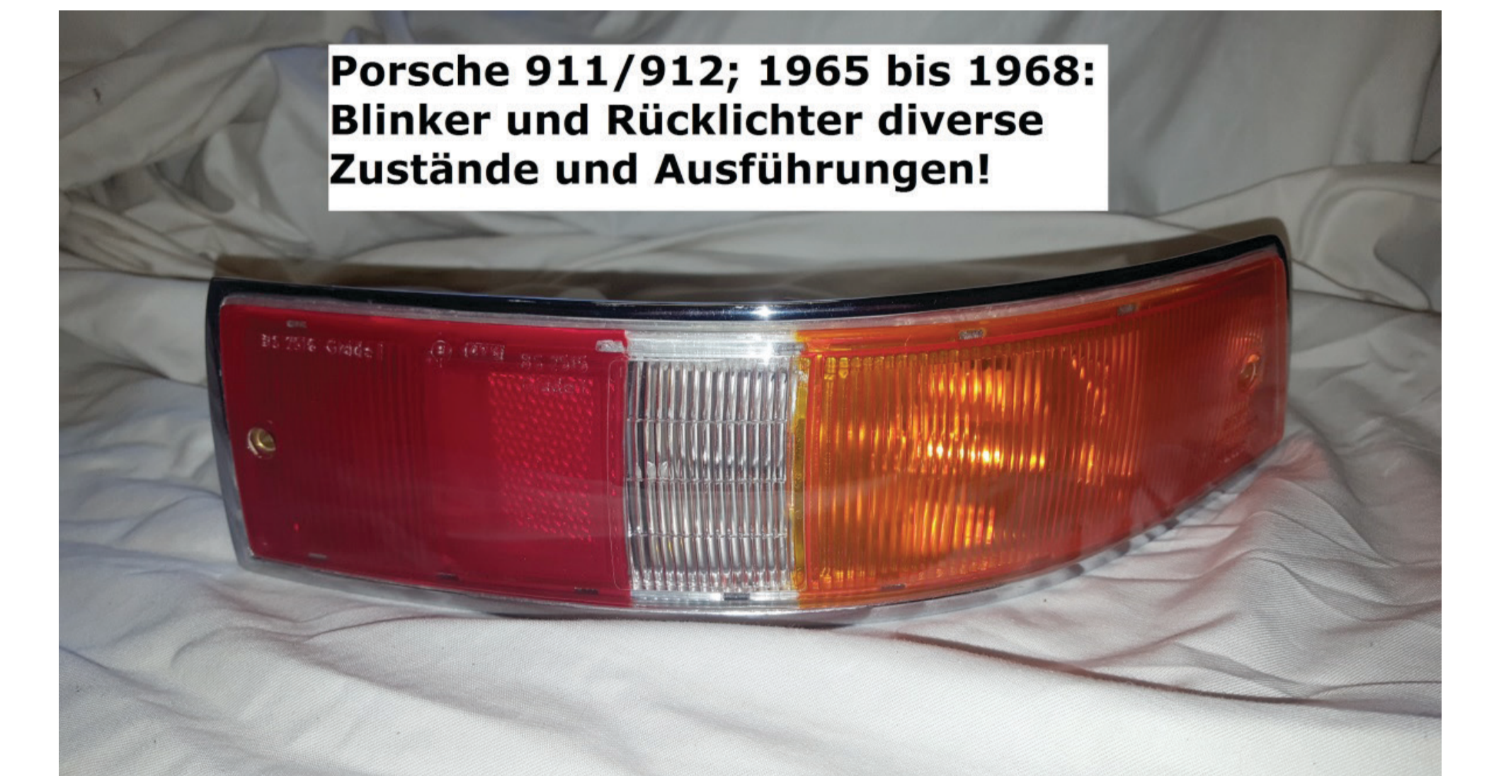
Porsche 911/912; 1965 bis 1968: Blinker und Rücklichter diverse Zustände und Ausführungen!