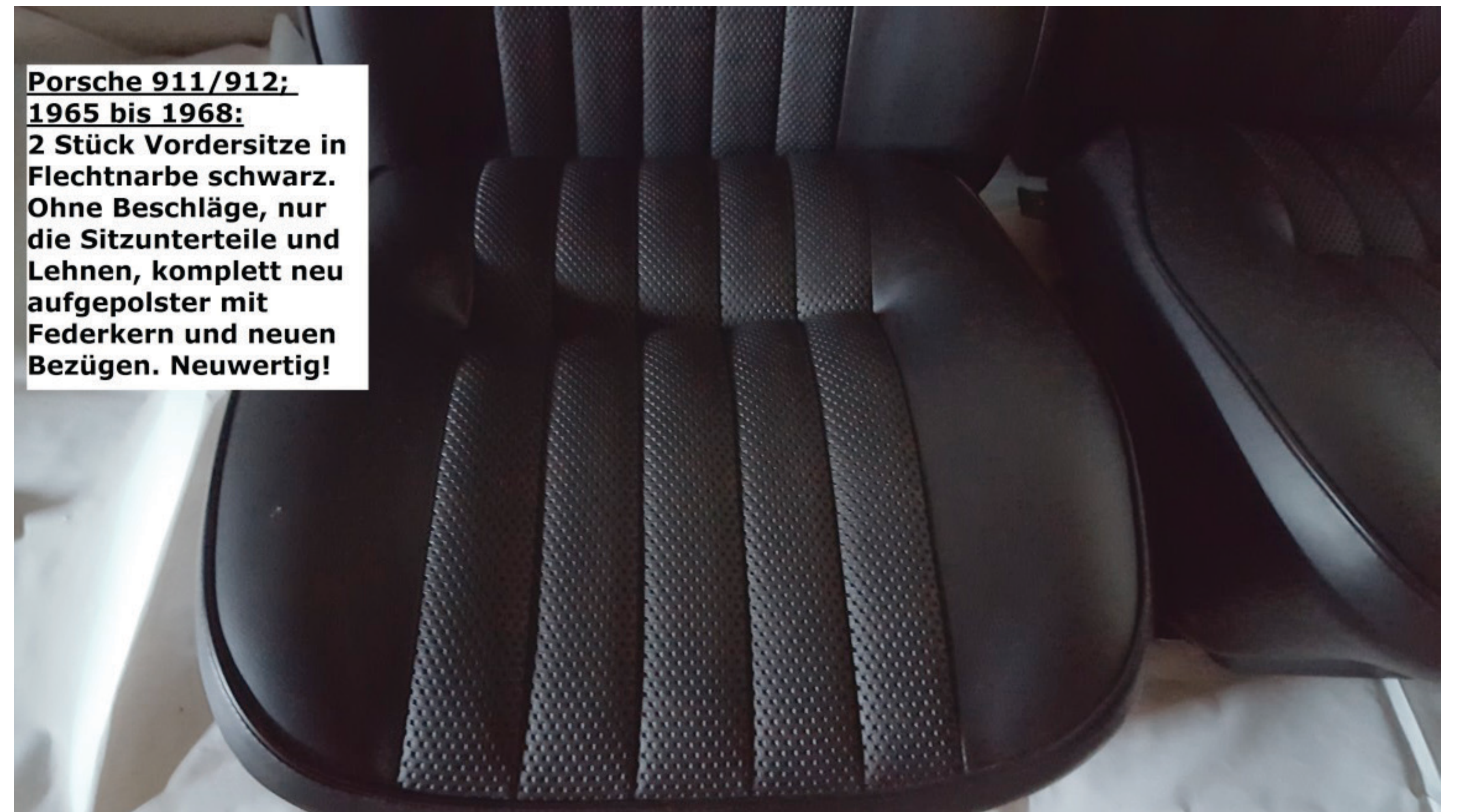
Porsche 911/912, 1965 bis 1968: 2 Stück Vordersitze in Flechnarbe schwarz. Ohne Beschläge, nur die Sitzunterteile und Lehnen, komplett neu aufgepolstert mit Federkern und neuen Bezügen. Neuwertig!