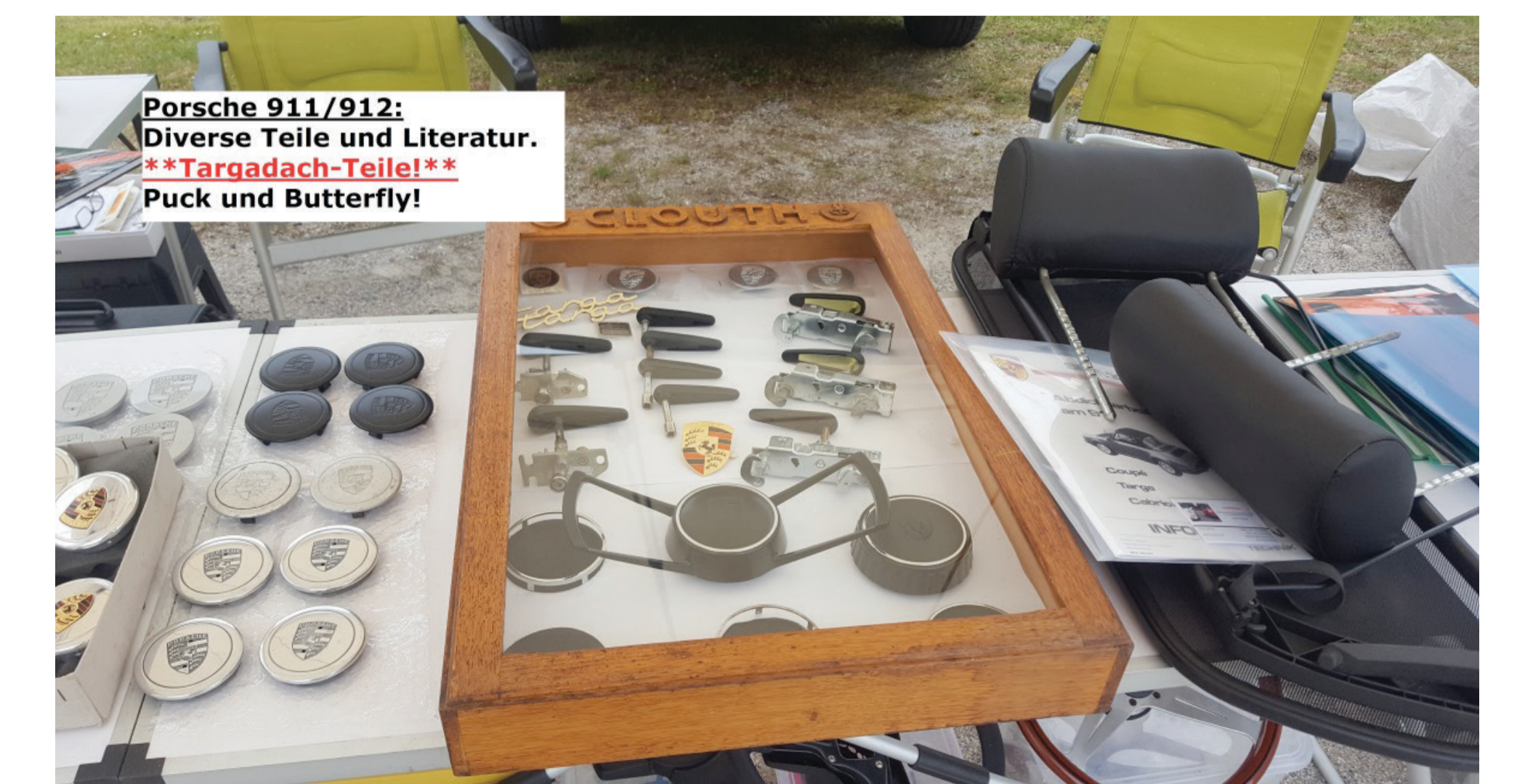
Porsche 911/912: Diverse Teile und Literatur. **Targadach-Teile! ** Puck und Butterfly!