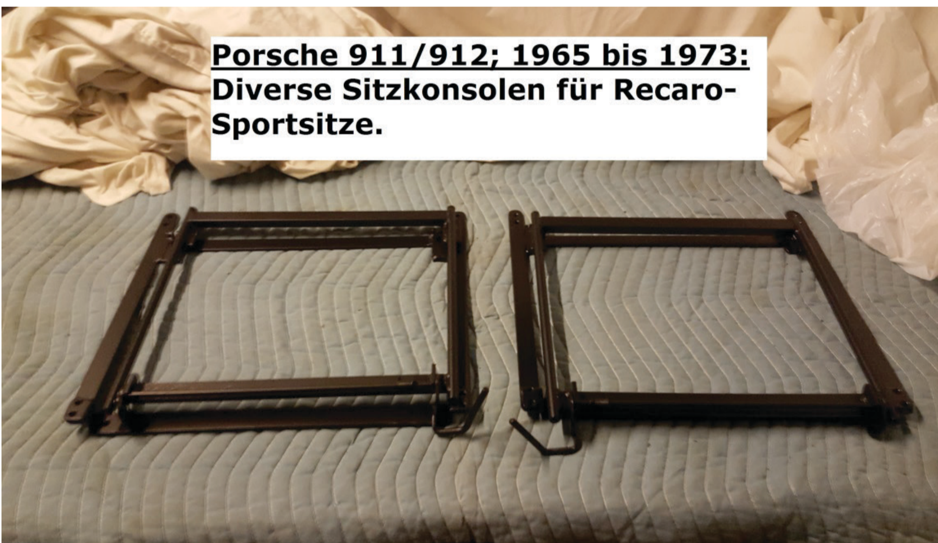
Porsche 911/912; 1965 bis 1973: Diverse Sitzkonsolen für Recaro-Sportsitze.