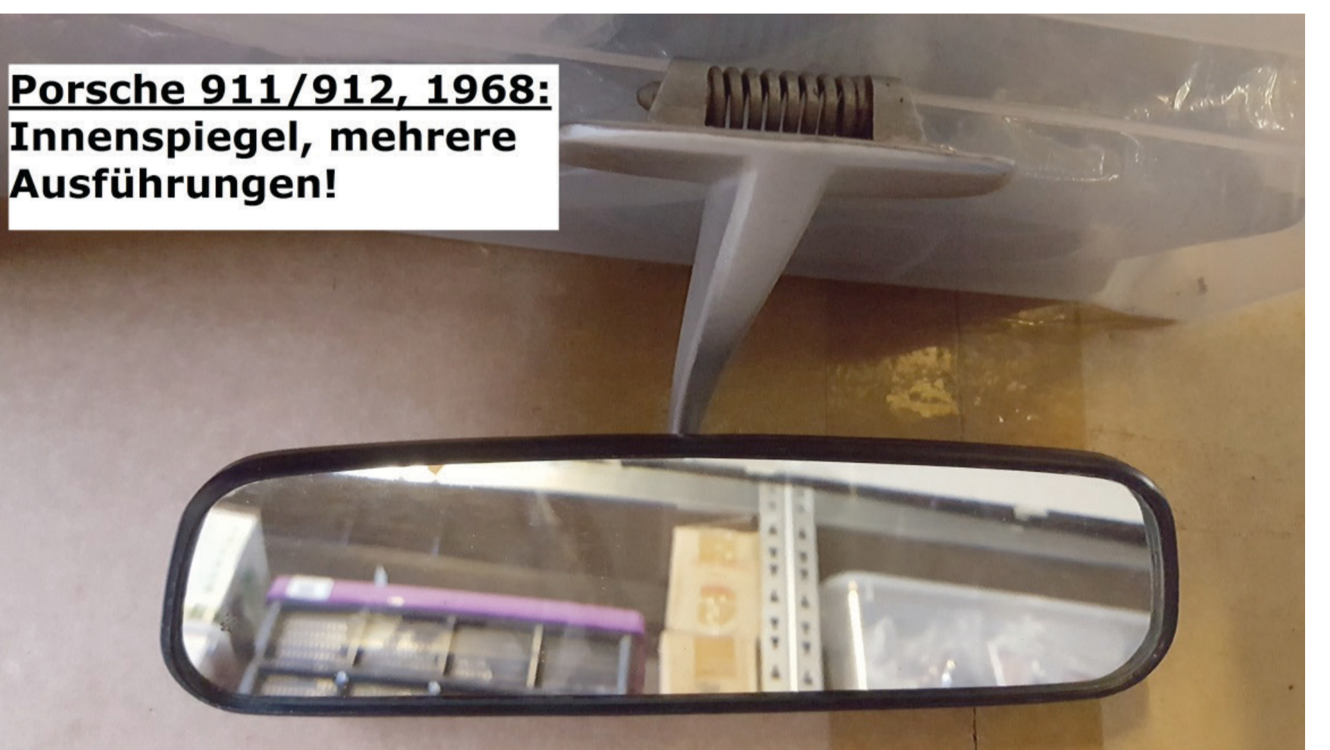
Porsche 911/912, 1968: Innenspiegel, mehrere Ausführungen!