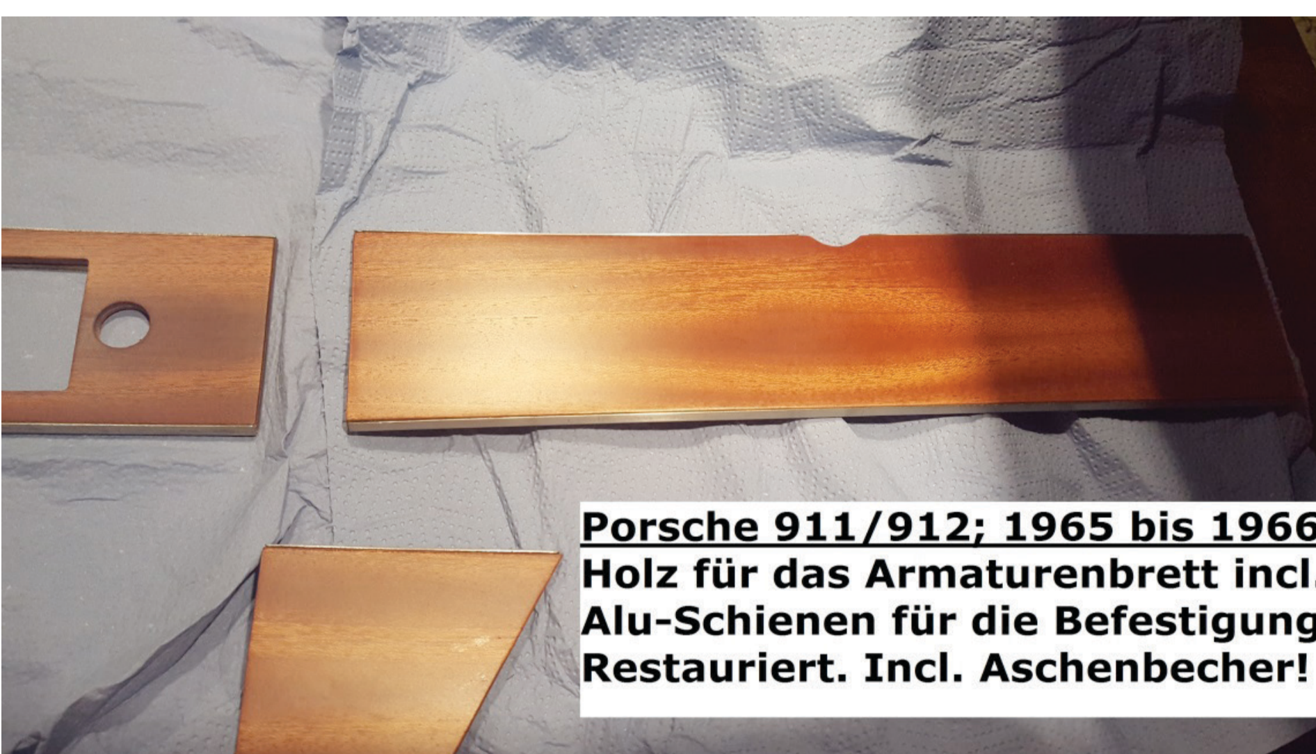
Porsche 911/912; 1965 bis 1966: Holz für das Armaturenbrett incl. Alu-Schienen für die Befestigung. Restauriert. Incl. Aschenbecher!