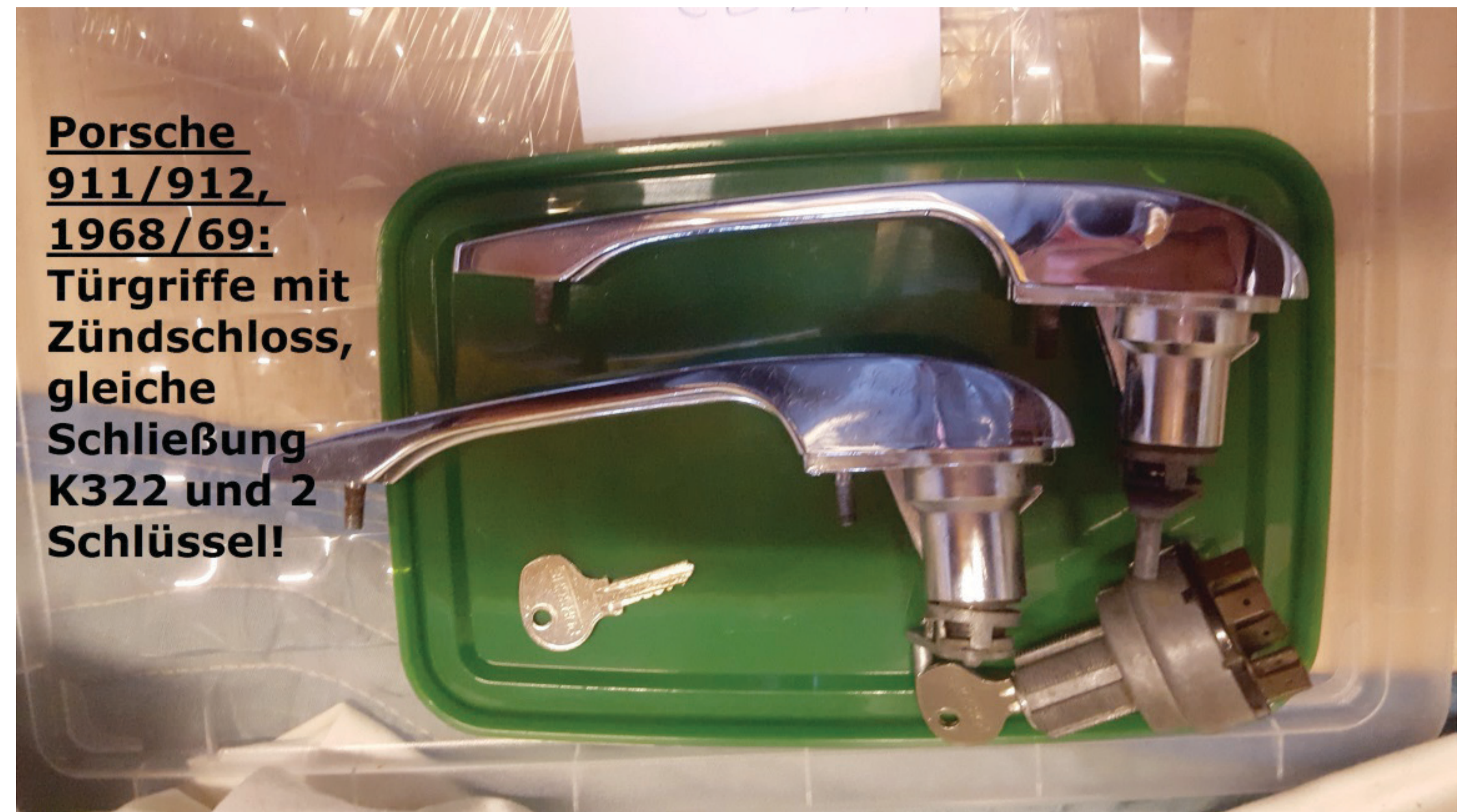
Porsche 911/912, 1968/69: Türgriffe mit Zündschloss, gleiche Schließung K322 und 2 Schlüssel!