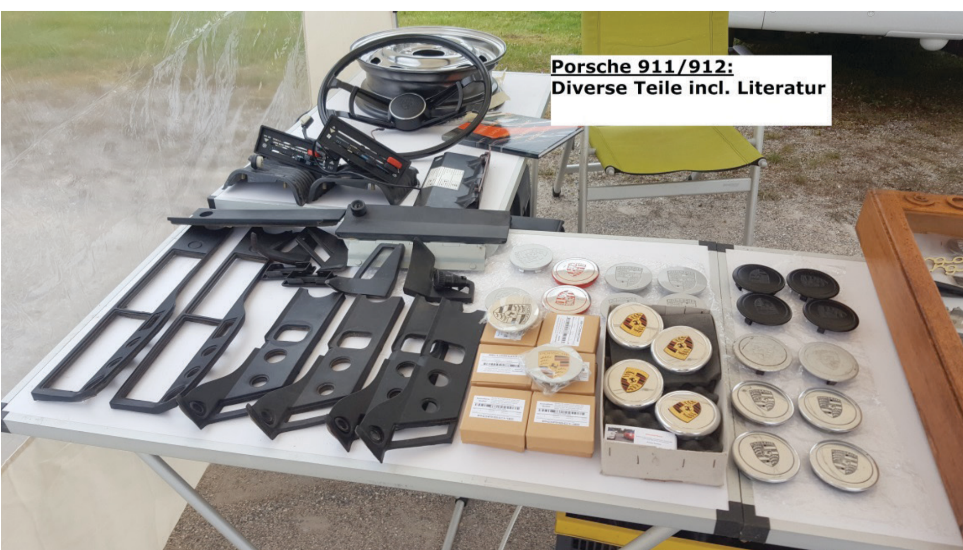
Porsche 911/912: Diverse Teile incl. Literatur