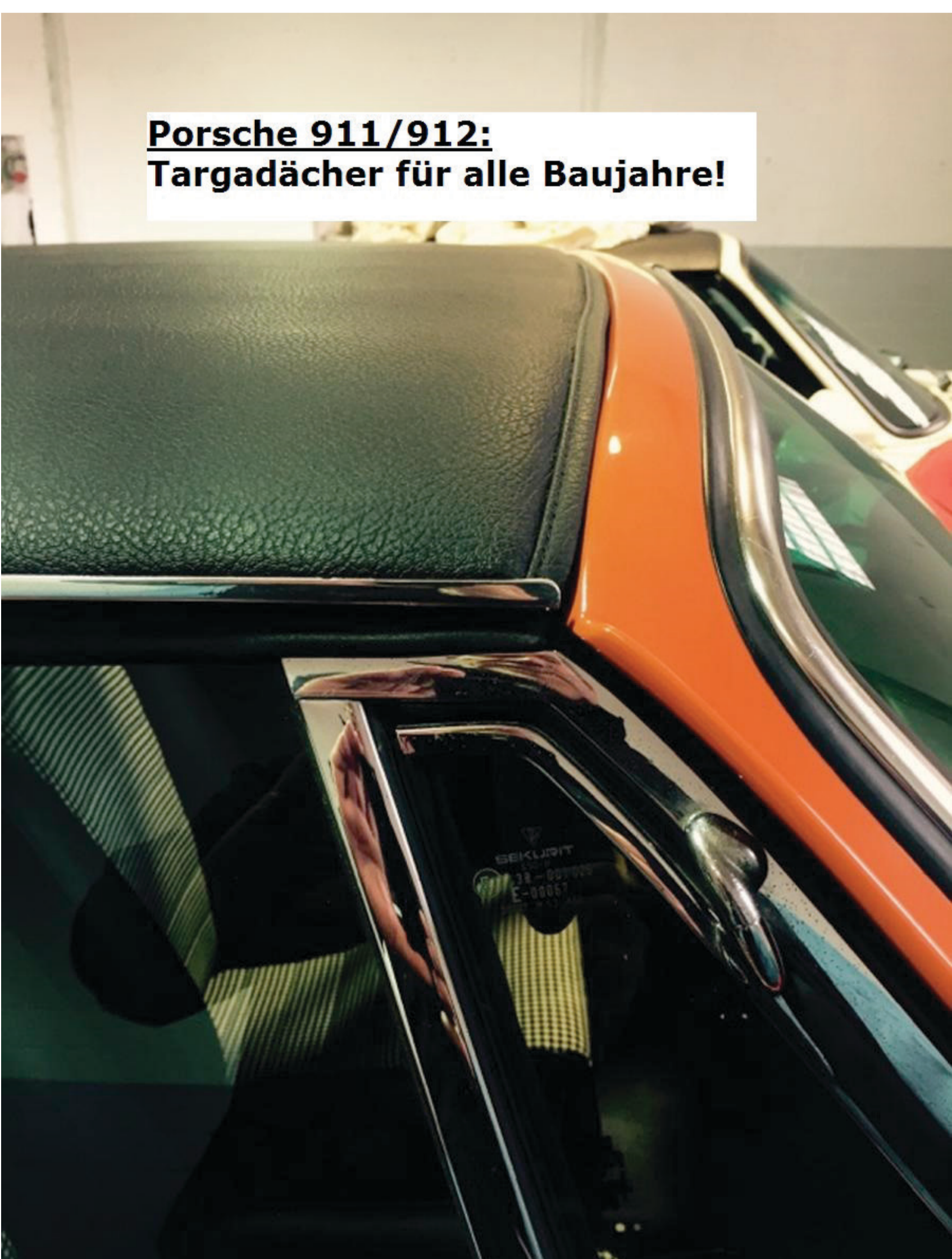
Porsche 911/912: Targadächer für alle Baujahre!